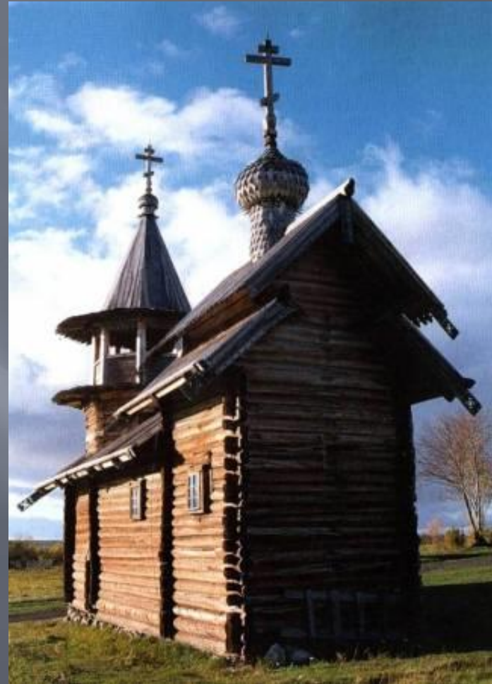
Часовня Михаила Архангела